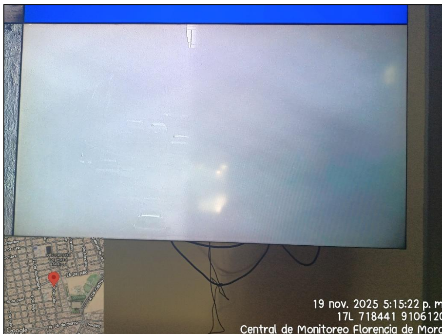
Imagen n.º4 Transmisión borrosa desde la cámara de videovigilancia