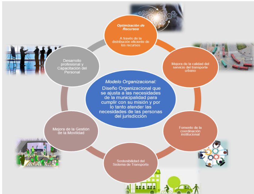
Figura 1. Concepto de Modelos Organizacionales